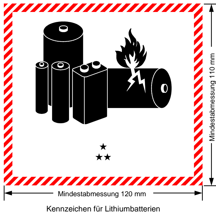
Kennzeichen für Lithiumbatterien