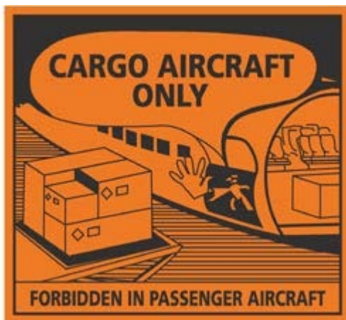
Abbildung 7.4.B: Abfertigungskennzeichen Nur mit Frachtflugzeug „Cargo Aircraft Only“ (CAO)

Symbol (sieben senkrechte Streifen in der oberen Hälfte; in der unteren Hälfte eine Ansammlung von Batterien, von denen eine beschädigt ist und Flammen entwickelt): Schwarz Hintergrund: Weiß