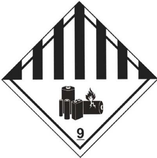
Abbildung 7.3.X: Klasse 9 – Lithium-Batterie